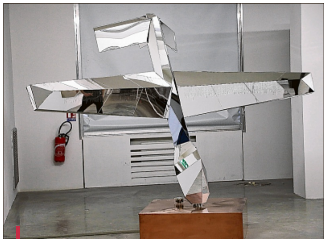
Cet étonnant "Drone memorial" du collectif locose fait partie de l'exposition "Supervisions" à voir à la Friche la Belle-de-Mai dans le cadre de "Chroniques".

"Supervisions" jusqu'au 16 décembre à la Friche la Belle-de-Mai, 11 rue Jobin, 3. Pass expo 8€. lafriche.org