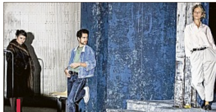
Christophe Honoré en archéologue des années sida.